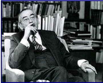
Тип современного богослова