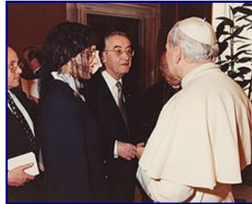
- Славно поработали!

Вот, что можно прочесть на многих новостных порталах, в частности посвященных этой тематике, о Новой Вульгате, сделанной на основе критических текстов: